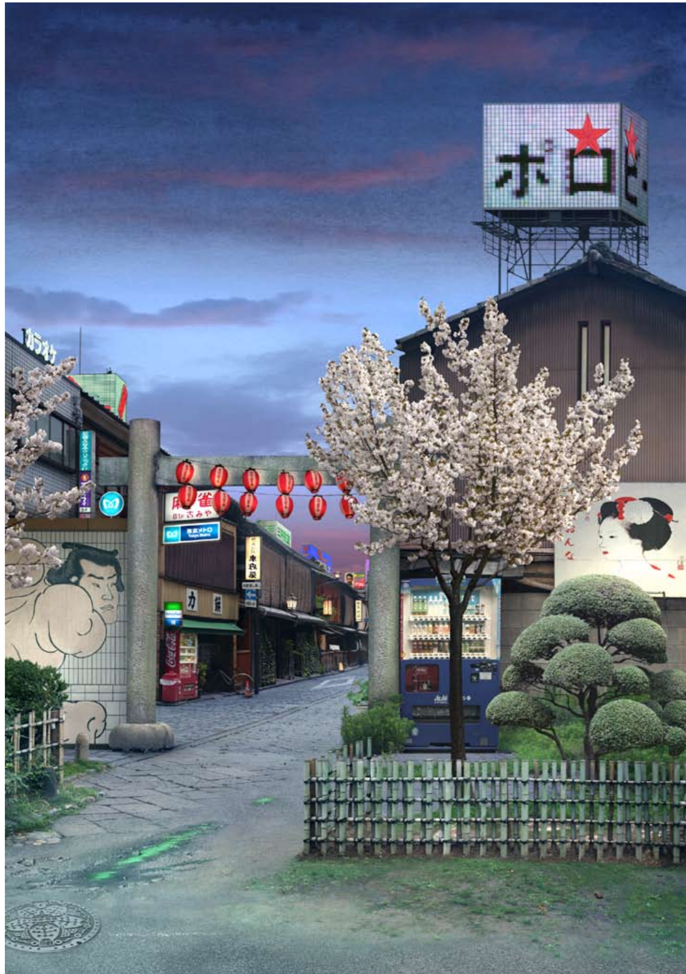
Tokyo Story 7: Nightfall (after Hiroshige) Transparency on lightbox (edition of 4, 116.4x81.5 cm, £6750 + VAT), Archival photographic print (edition of 6, 85 x 60 cm, £3420 +VAT)