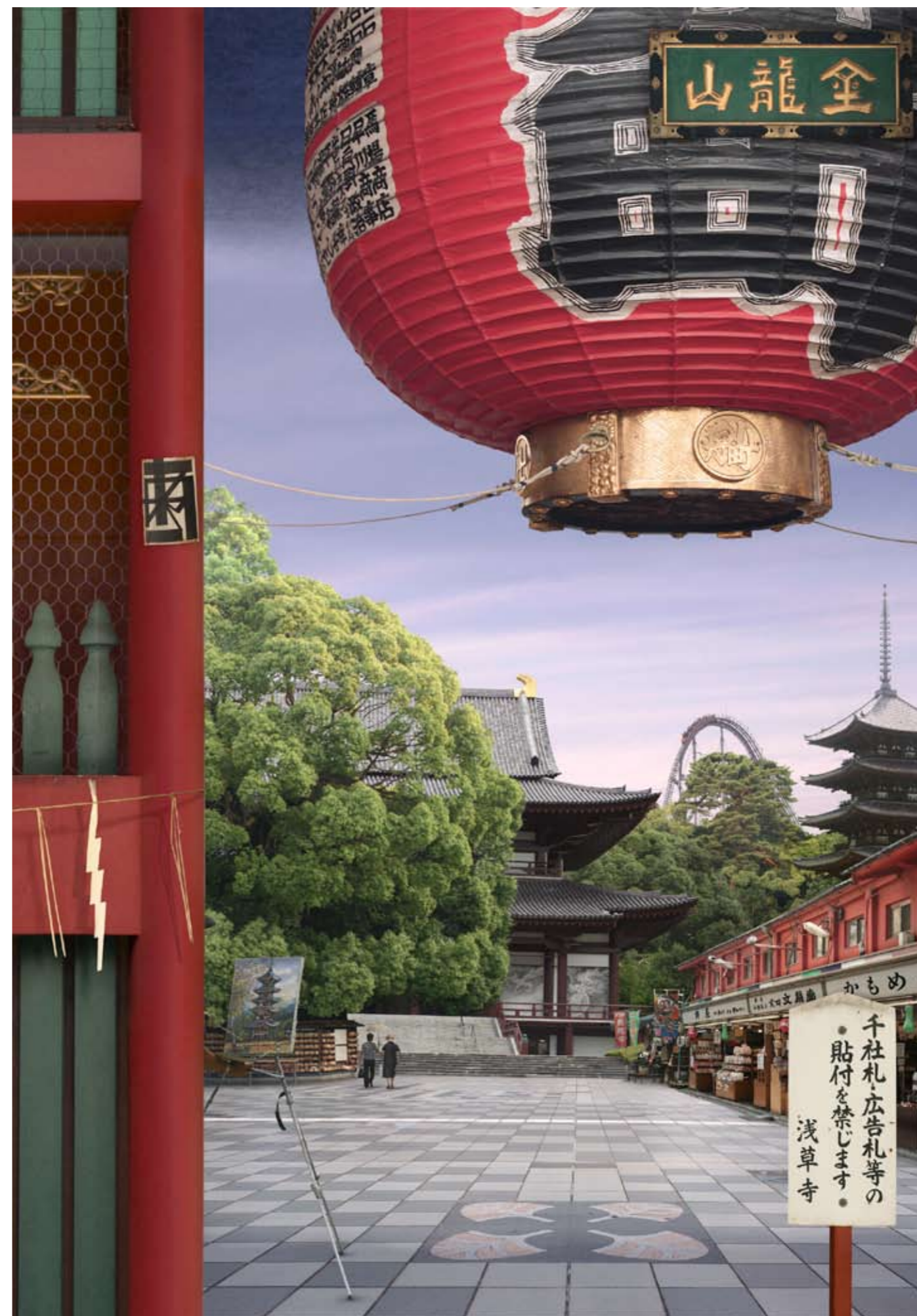
Tokyo Story 8: Temple (after Hiroshige) Transparency on lightbox (edition of 4, 116.4 x 81.5 cm, £6750 + VAT), Archival photographic print (edition of 6, 85 x 60 cm, £3420 + VAT)

Mi interessano gli spazi dove viviamo e dove ci muoviamo, specialmente nelle città moderne sovraffollate. Mi diverto a creare un'ambientazione in cui lo spettatore sia libero di entrare nell'opera, di fare al suo interno un viaggio personale, diventando protagonista della storia. Tra i miei progetti futuri c'è quello di esplorare l'architettura e le rovine di Londra e Roma sempre utilizzando la tecnica del collage digitale attraverso il filtro di Piranesi e dell'architetto Sir John Soane, per una mostra presso la sua residenza Pitzhanger Manor House a Londra, settembre 2012."