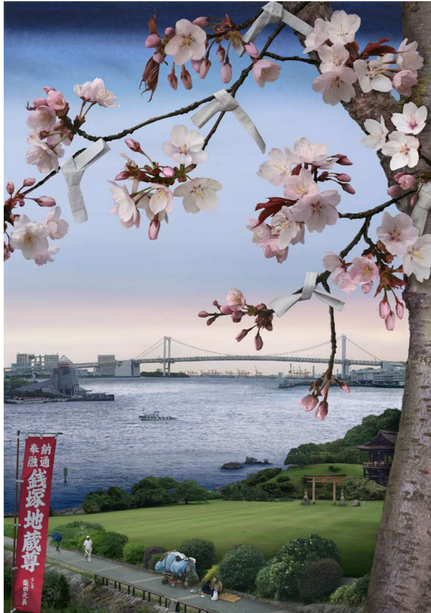
Tokyo Story 5: Cherry Blossom (after Hiroshige) Transparency on lightbox (edition of 4, 116.4 x 81.5 cm, £6750 + VAT), Archival photographic print (edition of 6, 85 x 60 cm, £3420 + VAT)