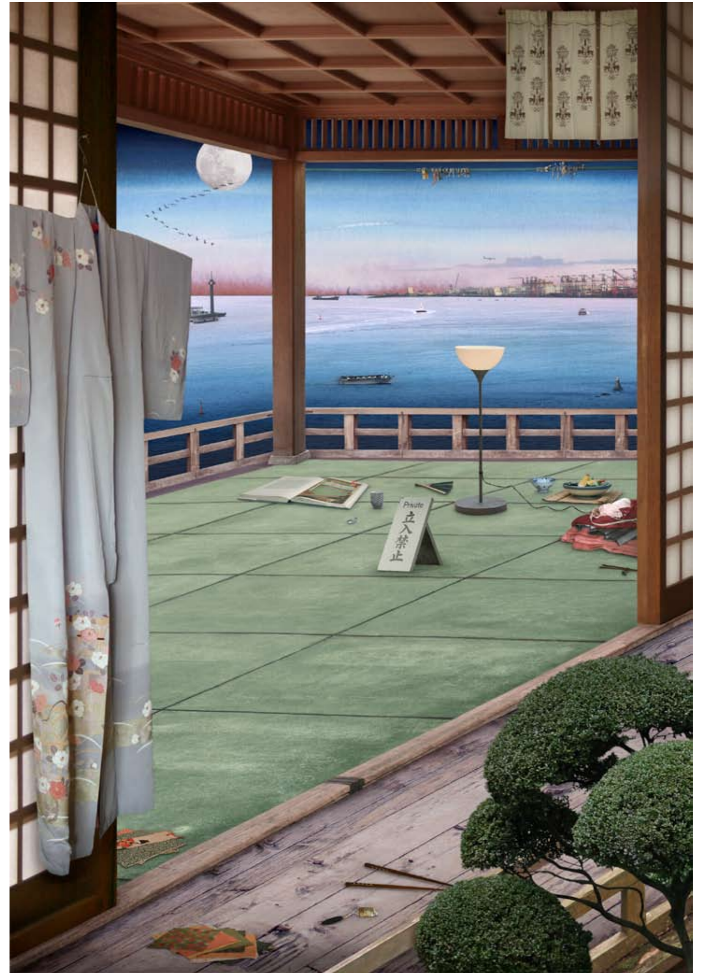
Tokyo Story 4: Interior (after Hiroshige) Transparency on lightbox (edition of 4, 116.4 x 81.5 cm, £6750 + VAT), Archival photographic print (edition of 6, 85 x 60 cm, £3420 + VAT)